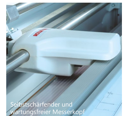
Selbstschärfender und wartungsfreier Messerkopf