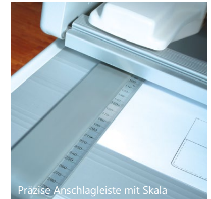
Präzise Anschlagleiste mit Skala