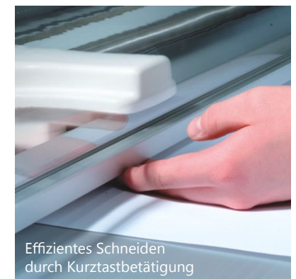
Effizientes Schneiden durch Kurztastbetätigung