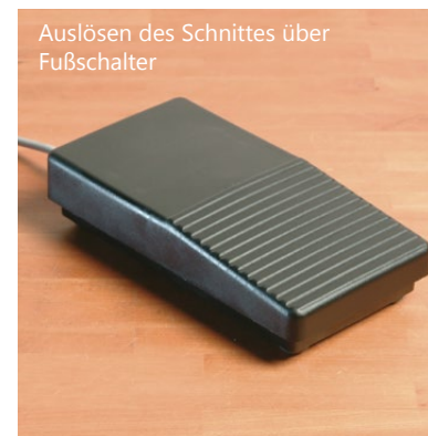
Auslösen des Schnittes über Fußschalter